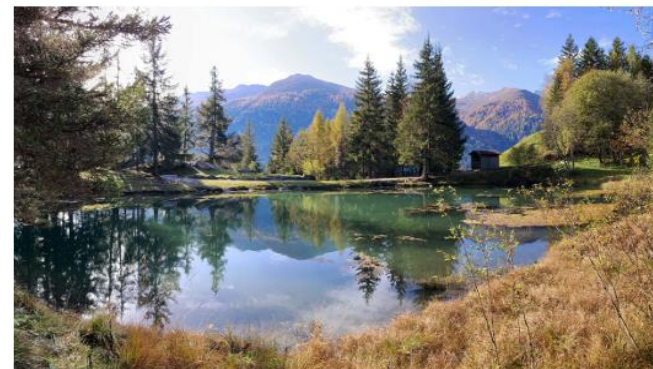
Wien, August 2023

Ein Programm des Klima- und Energiefonds der österreichischen Bundesregierung